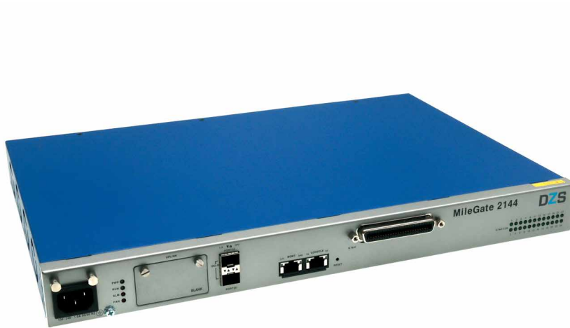
MileGate 2144 G.fast DPU (Distribution Point Unit)

24 G.fast Anschlüsse mit Profile 212a für den Ultra-Breitband-Anschluss aus Technikräumen (FTTB)