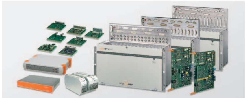
Bild 3: Baugruppen des SHDSL-Übertragungssystems: DTM, LCM, REG und Subracks

LineRunner LCM steht Ihnen als 2-Paar-Baugruppe; LineRunner DTMs als 1-Paar oder 2-Paar-Variante zur Verfügung. 2-Paar-Systeme erzielen eine größere Reichweite im Gegensatz zu den 1-Paar-Systemen. Alle 2-Paar-Systeme können per Netzmanagement auch in den 1-Paar-Betrieb geschaltet werden.